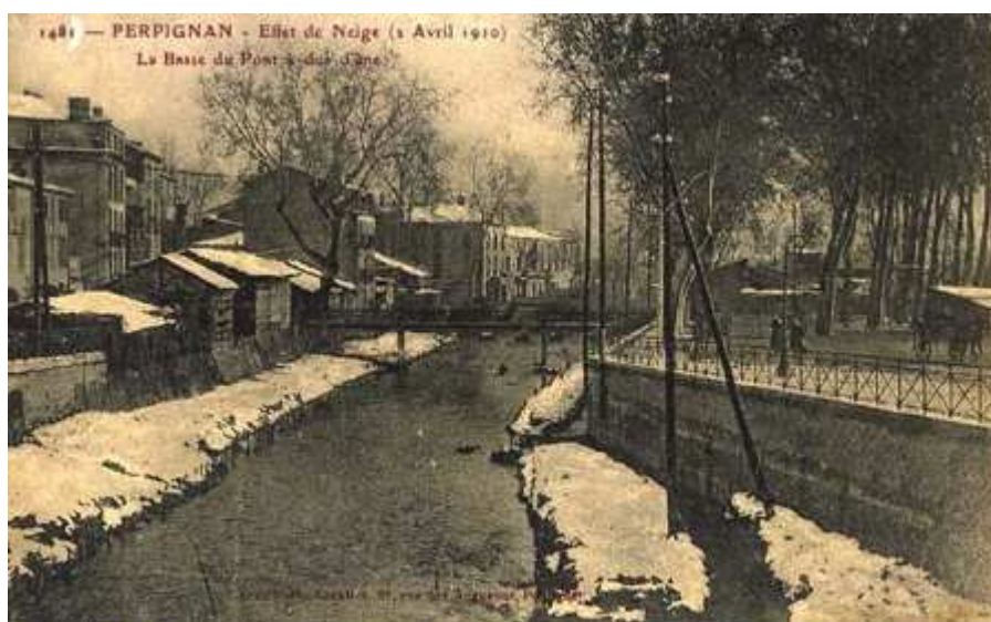
1er avril 1910 : Perpignan se réveille sous la neige!!

1er et 2 avril : abondantes chutes de neige sur le Languedoc-Roussillon et une partie du sud-ouest - il tombe jusqu'à 20 à 25cm de neige collante à Perpignan.