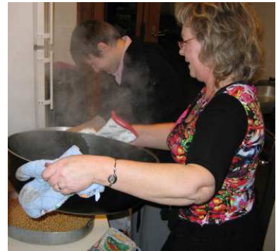
Mme La présidente en pleine préparation