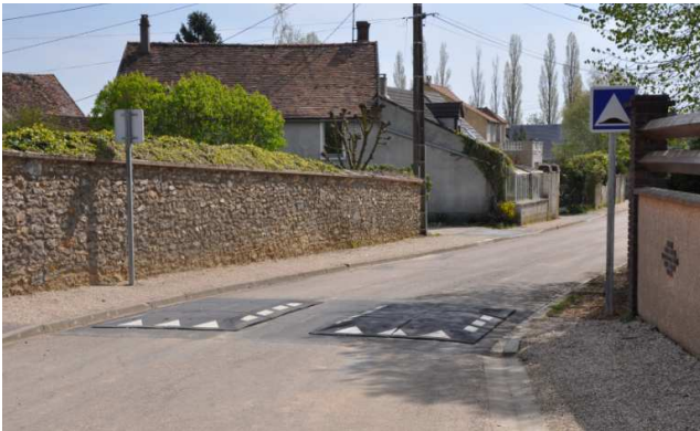
Ralentisseurs Lenainville Rue de la Plaine

Les anciens ralentisseurs de Paray ont été installés à Villiers. De nouveaux ralentisseurs béton ont été mis à la place