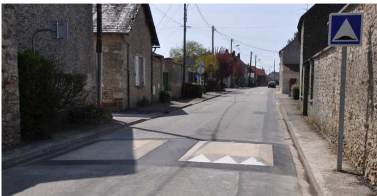
Nouveaux ralentisseurs à Paray rue Barthelemy