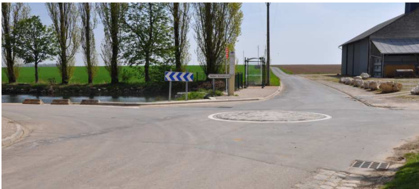
Rond point entrée Lenainville (remplace le stop)