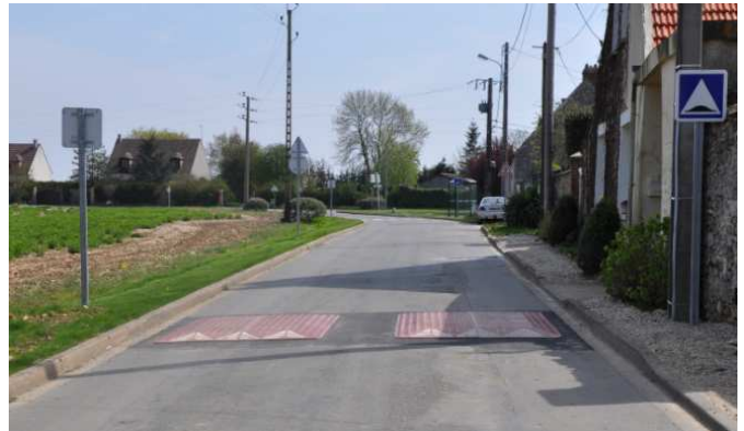
Ralentisseurs Villiers rue S te Croix